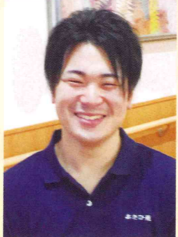
Mさん (介護スタッフ)

私は、お仕事説明会に出席をして入社することに決めました。介護未経験でしたが、説明会を受けて介護に対する考え方が変わりました。気さくに話しかけてくれる職員、明るい雰囲気がとても印象的でした。いざ、仕事が始まると印象通りの明るい雰囲気です。直ぐに馴染むことができました。そして、未経験ということでも、わからない事だらけでしたが、マンツーマン指導により、とても分かりやすく教えて頂き、今では自信を持って楽しく仕事をさせていたいております。