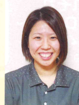
Uさん (介護スタッフ)

最初は10時間勤務と言われても想像がつかず、不安もありました。いざ、働いてみると一日一日があつという間です。2ヶ月間のマンツーマン指導により、仕事内容はやく覚えられました。職員の皆さんが明るく、毎日が楽しいです。途中で入社した私の意見や不安な点も受け入れて下さる先輩方がりなのでとても働きやすいです! また、休みが多くプライベートも充実しています。