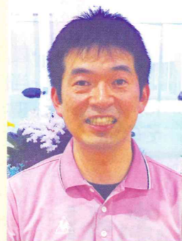
Tさん (介護スタッフ)

「しっかりとケアができて、しっかり休むことができる!」週休3日制の為、プライベートで自分の時間をしっかり確保することができます。「時間の余裕」があります。さらに、あかね会では、お子さんを預けながら働ける保育施設も併設されており、「近くにいる安心感」を常に得られる環境も整っています。保育士経験者の私でも自信を持ってオススメ致します!